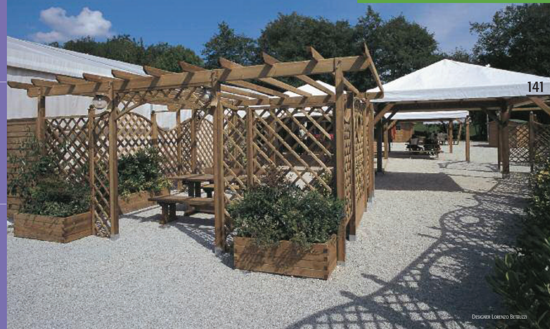
DESIGNER LORENZO BETTUZZI